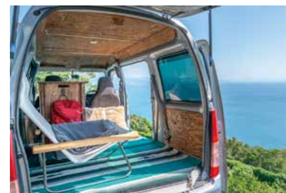
長期旅行のためのキャンピングカーとして利用*