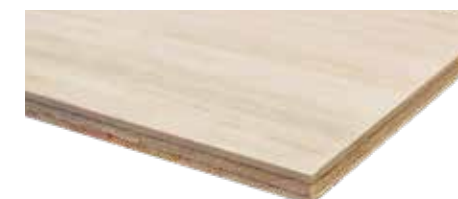
ヒノキ天然木積層板

ヒノキ天然木の薄板を積層したもので、国産ヒノキの節なし特注グレードを表面に使用しています。