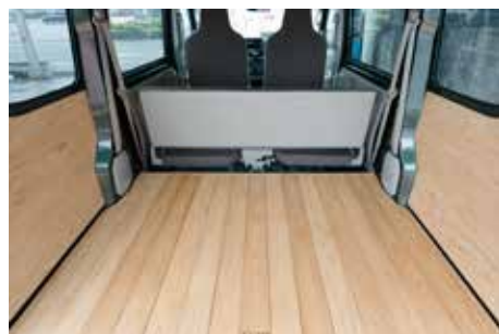
フロアを取り外して4人乗り