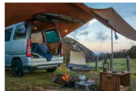
キャンプの際のシェルターとして利用*