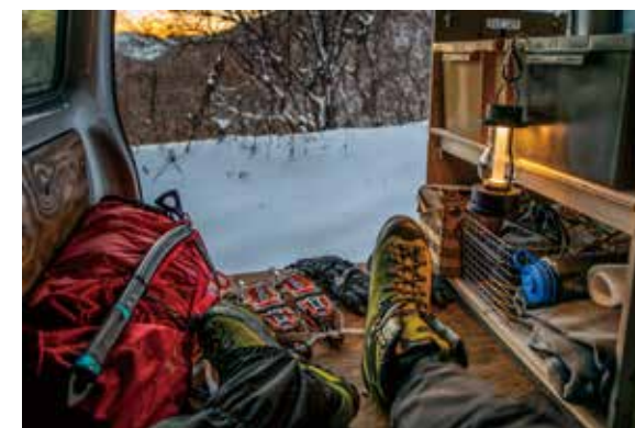
アクティビティの拠点として利用*