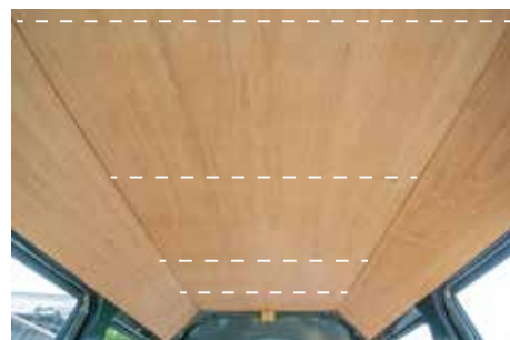
フレーム部分にビス施工可能