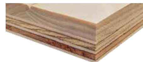
ヒノキ無垢フローリング

ベースとなる積層板にヒノキ無垢材を貼り付けた構造です。積層板を併用することで、無垢材の「反り」「変形」を最小限に抑えることができます。