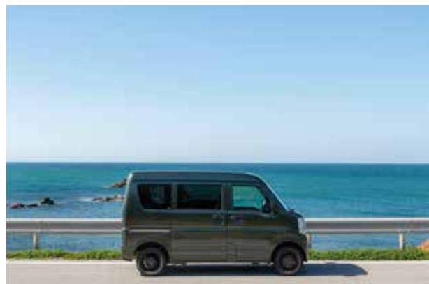
※ オプションホイール装着車両