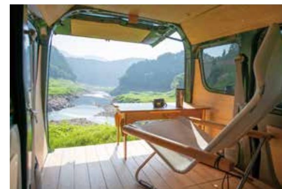
景色が良い場所で特等席として利用

市販のラグマットやアウトドア用品などを組み合わせれば、自分だけの秘密基地の完成です。