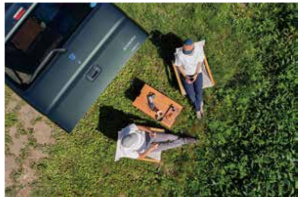
キャンプのシェルターとして

バンライフエブリーの天井やリアクォーターパネルには、DIY で様々なものを追加できます。趣味の道具をぶら下げたり、旅の道具を効率よく収納したり、オンリーワンの世界観を実現します。