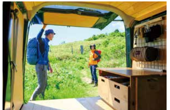
アクティビティの拠点として

お気に入りのギアと、ほんの少しのDIY でこんなに多種多様。ユーザー様のバンライフエブリーを少しだけご紹介します。