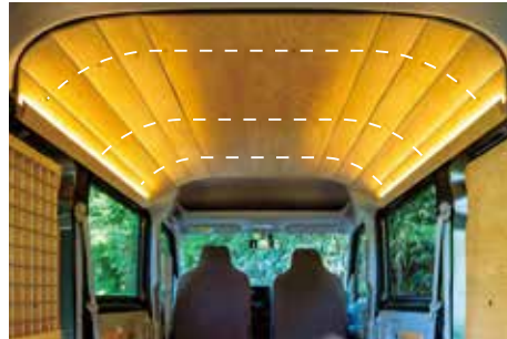
破線：フレーム部分