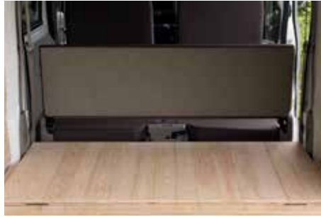
前フロアをラゲッジにスライドして4人乗りに